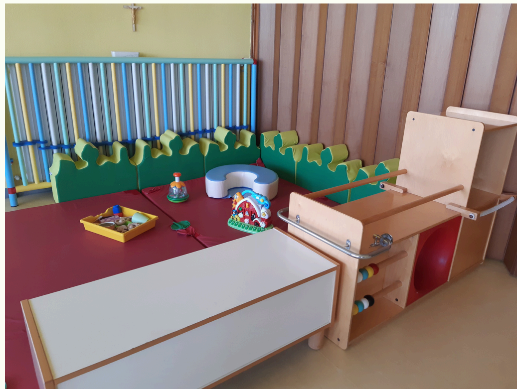
Spazio per i piccoli (3-18 mesi)

Gli spazi sono suddivisi secondo le età e le necessità di gioco dei/le bambini/e.