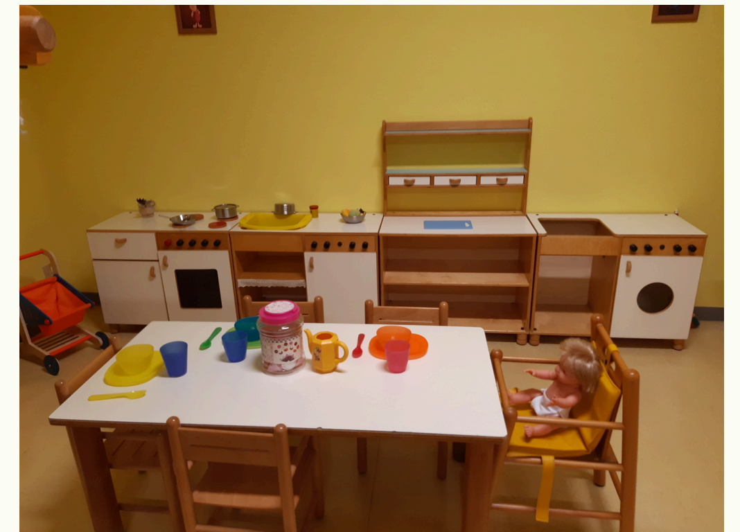
Spazio per i grandi (18-36 mesi)