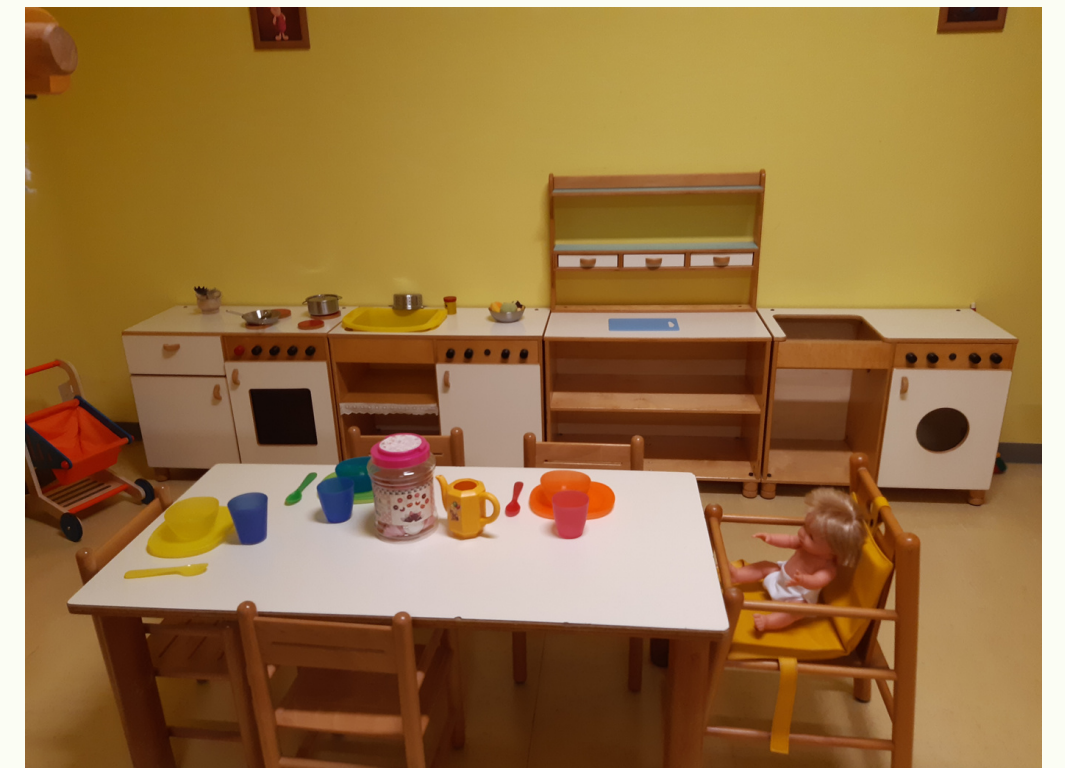
Spazio per i grandi (18-36 mesi)